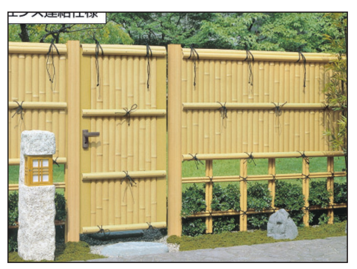
FTK#2 with door