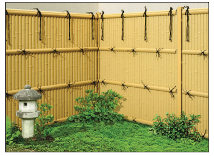
FTK#2 - Corner