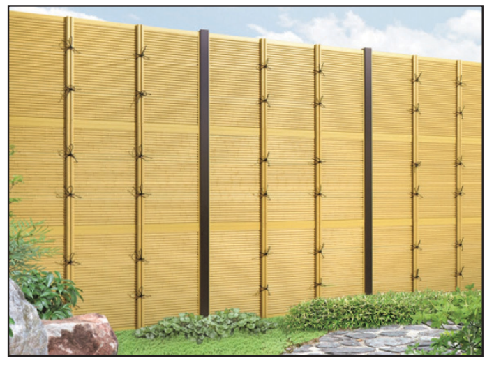
FTK#1 stacked 2-up