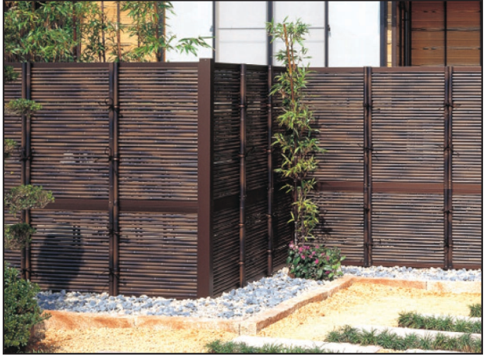
FTK#1 in Dark Color