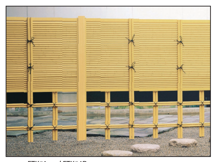
FTK#1 and FTK#4D