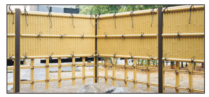
FTK#2 and #4