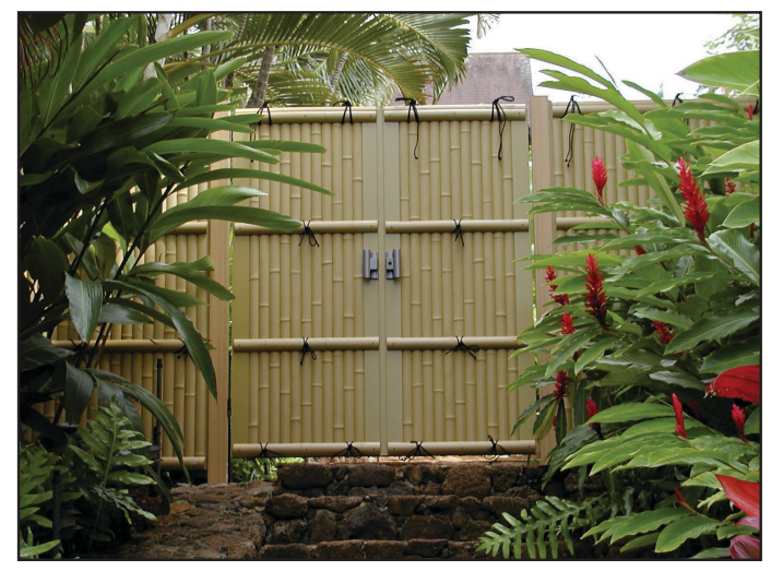
FTK#1 Gate and Fence in Honolulu