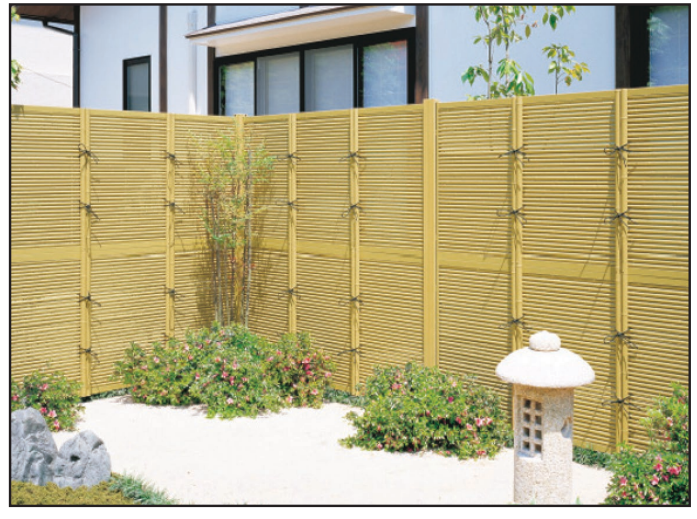
FTK#1 stacked 2-up