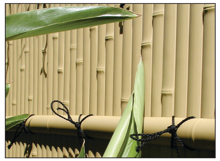
FTK#2 in Honolulu