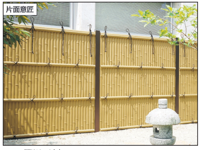
FTK#2 with brown posts