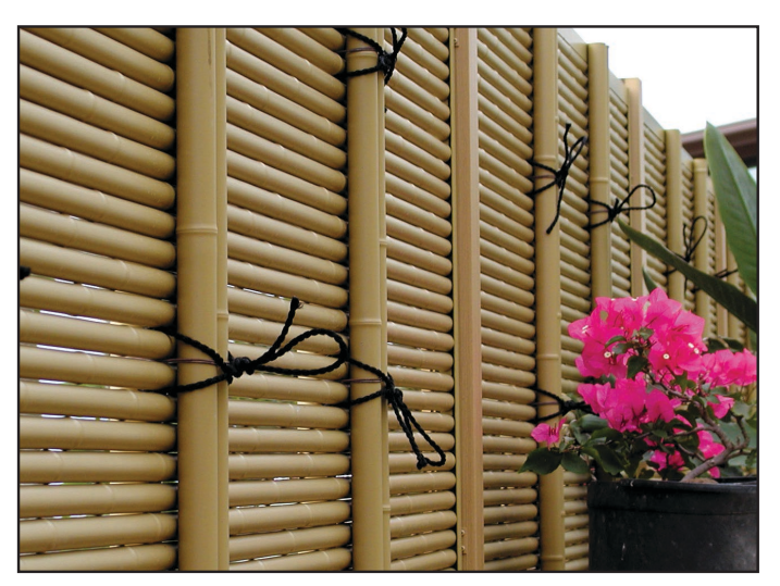
FTK#1 in Honolulu