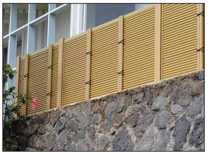
FTK#1 in Honolulu