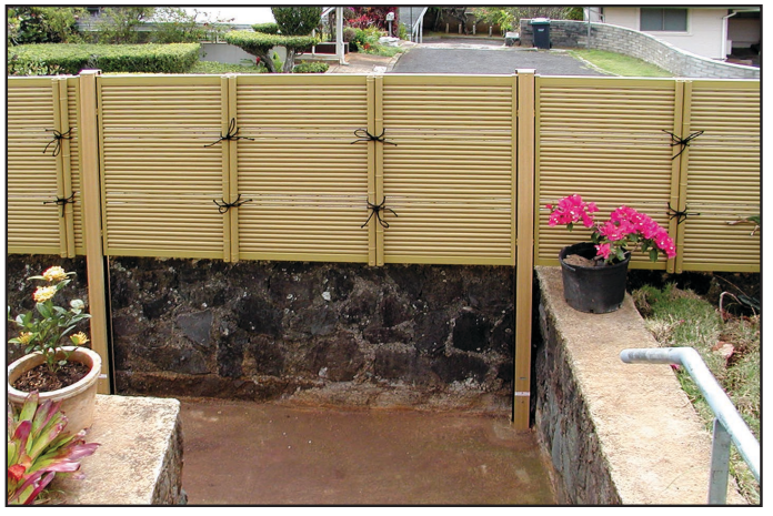
FTK#1 in Honolulu